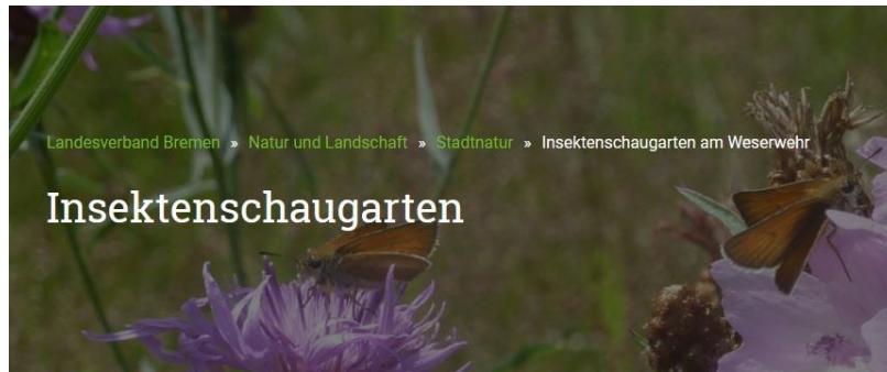
Figure 2 Zur weiteren Info bitte das Foto anklicken / antippen

Figure 1 Zur weiteren Info das Foto anklicken